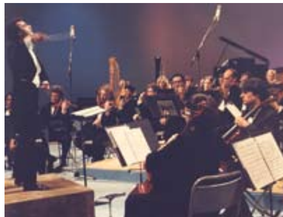
Dirigiendo la orquesta Filarmónica de Caracas en 1979

El título de Maestro no está vinculado a un título académico sino, más bien, por méritos de experien-